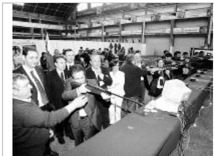
El presidente regional practicó el tiro con carabina.

Todas las autoridades destacaron las favorables expectativas con las que nace la feria que organiza la Sociedad Cántabra de Fomento de Caza y Pesca, a la que se advierte un prometedor futuro, teniendo en cuenta la buena asistencia de público que registró ayer y que reúne 42 expositores de los sectores del deporte, caza, pesca, cuchillería, ferretería, motor, náutica, trofeos y productos para el perro. Otros alicientes son la participación de las federaciones española y cántabra de tiro olímpico y de caza con arco, del Seprona de la Guardia Civil, y la celebración de actividades complementarias, fuera y dentro del Ferial. Para hoy, domingo, están programadas pruebas de trabajo de perros de muestra, en el campo de La Masera de Suances, (de 9 a 11 horas); de caza con arco, tiro olímpico y con carabina, y exposición-venta de perros (de 11 a 14,30 y de 17 a 21 horas); demostración de lectura de Alas de Becada y montaje de aparejos (de 12 a 12,30), y jornada de pesca marítima en El Sardinero.