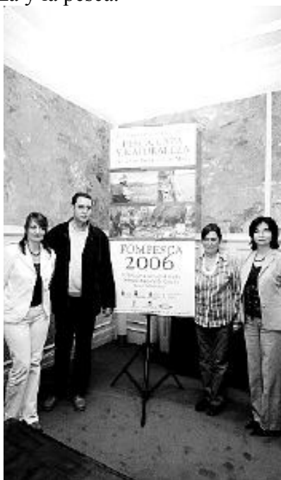
Autoridades y organización, en la presentación.

Organizada por la Sociedad Cántabra de Fomento de Caza y Pesca, Fompesca contará con la colaboración, y presencia activa, de las Consejerías de Ganadería, Obras Públicas y Turismo, del Ayuntamiento, del Seprona, de las Federaciones española y cántabra de tiro olímpico y de caza con arco, y de un gran número de firmas comerciales de los sectores del deporte, la caza, la pesca, la cuchillería, la ferretería, el motor, los trofeos y los productos relacionados con el mundo del perro.