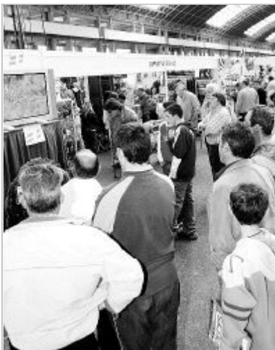
La muestra ha tenido una notable afluencia de público.